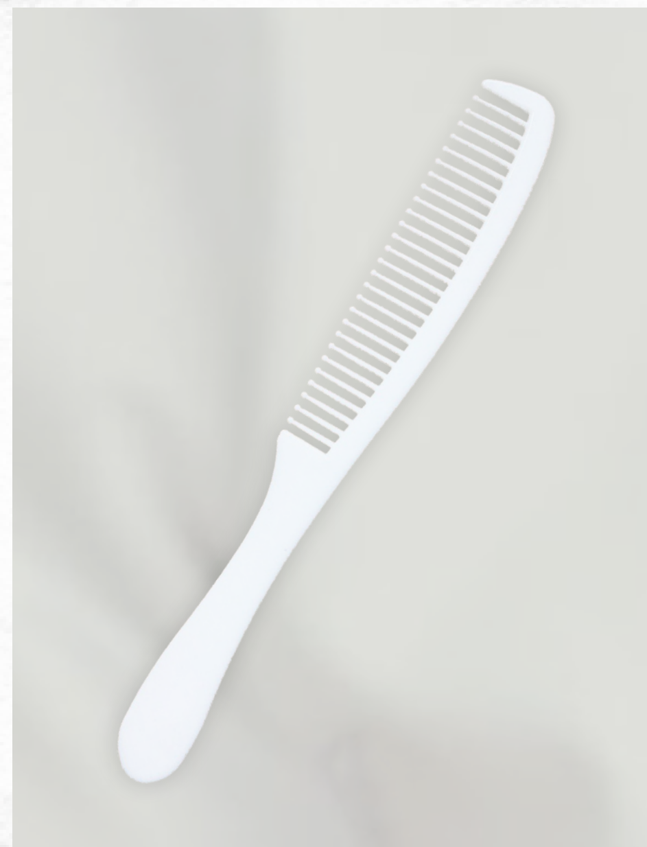
—— 梳子或拋棄式毛流刷 ——

幫人除毛前需剪指甲，避免在蹦緊皮膚時指甲插入皮膚如陰囊處最容易受傷。手套需合手，勿過大或過小，影響操作除毛。