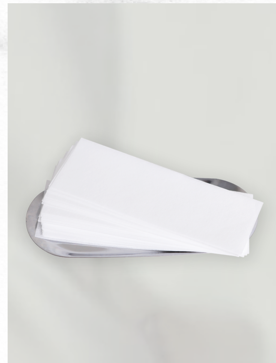
—— 拋棄式軟蠟除毛布 ——

梳子或拋棄式毛流刷，主要是要將雜亂毛流梳順，先確定毛流方向後，才可以正確上蠟，常用於私密毛髮、眉毛等部位。